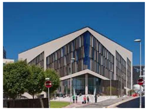
Technology and Innovation Centre Uniwersytetu Strathclyde University w Glasgow, gdzie odbyła się konferencja podsumowująca projekt LIST

„Umiejętności cyfrowe i użycie ICT mają kluczowe znaczenie dla aktywności obywatelskiej wszystkich ludzi obecnie i w przyszłości, zarówno na poziomie UE, jak i globalnie. Powinny one stanowić podstawę wszelkich planowanych strategii uczenia się przez całe życie”.